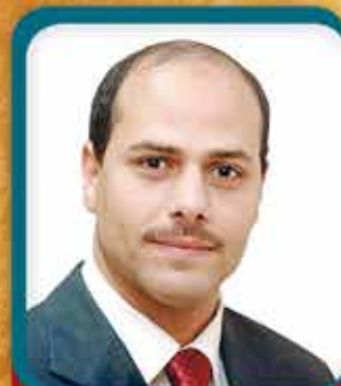
التصميم والإخراج : د. فتحى إبراهيم الأستاذ المساعد بقسم الإعلام - كلية الآداب