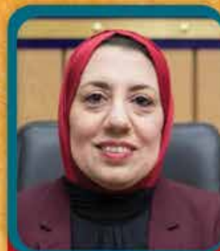
أ.د. جيهان عبدالهادي نائب رئيس الجامعة لشئون الدراسات العليا والبحوث

أكتوبر 2025 - نشرة تصدر ربع سنوية عن قطاع خدمة المجتمع وتنمية البيئة بجامعة بنها